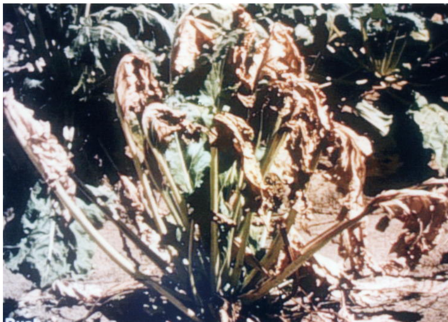
شکل ۱- زردی و پژمردگی چغندر قند در اثر آلودگی به Fusarium oxysporum f.sp. betae