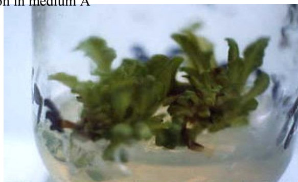
Fig. 2 Shoot multiplication in medium PII

شکل ۳ ریشه زایی طبیعی ریزگیاهچه ها در سیستم " آب کشت "