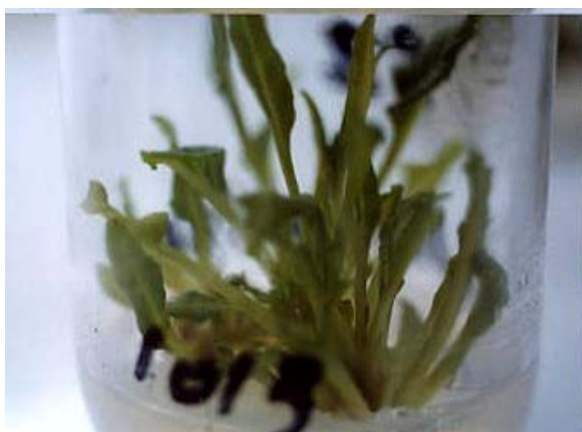
شکل ۱ ازدياد ريزجوانه در محيط A

آبرساني و تغذيه کودي همزمان تأمين پارامترهاي رشد فتواتوتروفیک براي توليد ريزگياه‌چه در سطح وسيع داراي امتياز مي باشد. نتايج بررسي‌هاي به عمل آمده در اجراي اين طرح، نشان داد که با فراهم آمدن امکانات و تجهيزات مناسب، توليد نيمه صنعتي گياهان به روش ريزازديادي قابل حصول است. اين نتايج براي نخستين بار و در ايران در چارچوب اجراي پروژه ملي شماره ۱۲۴۲