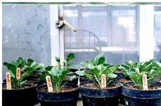
Fig. 5 Established sugar beet clones in greenhouse

شکل ۵ استقرار کلون های چغندر قند در شرایط گلخانه