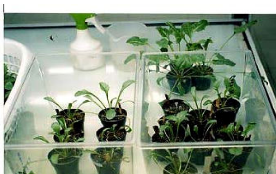
Fig. 4 Autotrophic micro plants transferred into pots

شکل ۵ استقرار کلون های چغندر قند در شرایط گلخانه